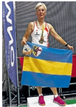
Wielkie brawa i gratulacje dla zawodniczki z Chrzęstawy!

Podczas NordicWalking World Cup w Turynie zdobyła: Indywidualne Mistrzostwo w kategorii na 10 km i Sztafetowe Mistrzostwo NordicWalking - Sztafety Żeńskie.